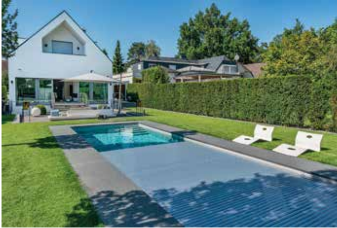
Eine Schwimmbadabdeckung spart bis zu 80 Prozent Energie und verhindert die Verschmutzung.

Ein Swimmingpool im Garten kann vielseitig genutzt werden. Damit er von Anfang an erfüllt, was sich der Poolnutzer wünscht, hat der Bundesverband Schwimmbad & Wellness e.V. (bsw) zehn goldene Regeln für den Schwimmbadbau veröffentlicht.