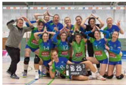
Sport Neuseenland-Volleys auf Weg in 3. Liga