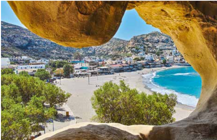
Blick auf Matala aus einer der in der Jungsteinzeit in das poröse Gestein gehauenen Wohnhöhlen.

Ein schöner und interessanter Ausflug ist auch die Stadt Matala im Süden von Kreta. Hier soll einst Göttervater Zeus in Stiergestalt, mit der schönen Prinzessin Europa auf dem Rücken, aus dem Meer gestiegen sein. Daher wird diesem Ort eine magische Anziehungskraft zugeschrieben.