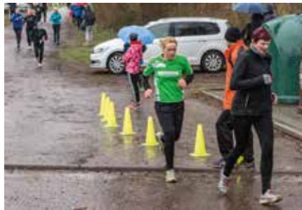
Unsere Leichtathletinnen – hier beim Crosslauf in Kitzscher – sind seit vielen Jahren erfolgreich.

Seit über einhundert Jahren feiern wir den Internationalen Frauentag. Heute müssen wir nicht mehr um unsere Rechte kämpfen, wir haben längst einen Platz in der Gesellschaft gefunden. Wir sind engagiert und interessiert und sportlich sind wir auch.