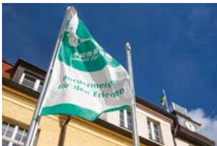
Markkleeberg aktuell Mayors for Peace: Zeichen für den Frieden