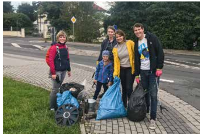
Müllsammelaktion beim World Cleanup-Day am 18. September 2021.

Aber auch weitere Aktionen der Steuerungsgruppe konnten im letzten Jahr Erfolg versprechend durchgeführt werden. So nahm das Team Fairtrade erstmals beim Cleanup-Day 2021 im September teil. Die kleine Gruppe sammelte entlang der Koburger Straße