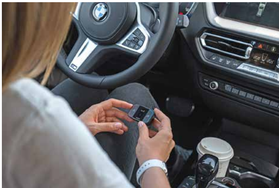
Die Gadgets sind in etwa so groß wie eine Computermouse und werden mit einer Halterung in der Fahrgastzelle angebracht. (Fotos: djd/www.saphe.dk)

Feierabendverkehr auf der Autobahn, die Dunkelheit bricht herein und es beginnt zu regnen. Gefahrenstellen sind nicht mehr auf Anhieb zu erkennen. Liegt nun ein Stauende in einer Kurve, kann es brenzlich werden. Nach Angaben des Statistischen Bundesamtes kam es im Jahr 2020 zu rund 2,25 Millionen Verkehrsunfällen in Deutschland. Dabei ließen 2.719 Menschen ihr Leben. Für mehr Sicherheit sollen Verkehrsalarme – technische Helfer, die vor Gefahren warnen – sorgen. Sie werden mit einer Halterung in der Fahrgastzelle, zum Beispiel an der Lüftung, angebracht. Die Mini-Varianten für Motorradfahrer müssen in Ohrnähe an der Innenseite des Helms befestigt werden. Eines haben die akkubetriebenen Gadgets gemeinsam: Droht Gefahr, schlagen sie Alarm.