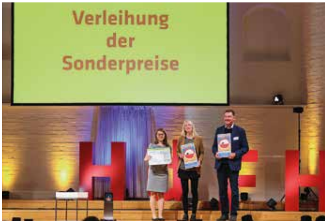
Preisverleihung „Hauptstadt des Fairen Handels“ an Markkleeberg und Leipzig.

Die Stadt Markkleeberg trägt seit 2015 den Titel Fairtrade-Town. Doch was steckt eigentlich dahinter? Mittlerweile verbirgt sich viel mehr hinter dem Titel als nur die Erfüllung der fünf Kriterien (1. Stadtratsbeschluss, 2. Gründung einer Steuerungsgruppe, 3. Produkte in Einzelhandel und Gastronomie, 4. Produkte in Schulen, Kirchen und Vereinen, 5. Öffentlichkeitsarbeit). Die Steuerungsgruppe Fairtrade Markkleeberg ist mittlerweile über die Stadtgrenzen hinaus gut vernetzt und organisiert mit den anderen sächsischen Fairtrade-Towns gemeinsame, öffentlichkeitswirksame Aktionen oder unterstützt Kommunen, die ebenfalls Fairtrade-Städte werden wollen.