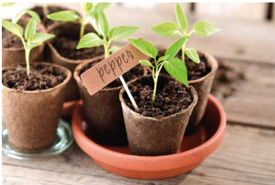
Wer einmal Samen aus seinen selbstangebauten Pflanzen gewinnen möchte, sollte auf samenfeste Sorten achten.

Viele Gartencenter bieten Hobbygärtnern eine große Palette an Anzuchtthilen. Von der einfachen Saatschale über die selbstbefeuchtende Aussaatbox bis zur vollautomatischen und beheizten Mini-Aufzuchtstation ist alles zu haben. Doch was ist wirklich nötig? Wenn man