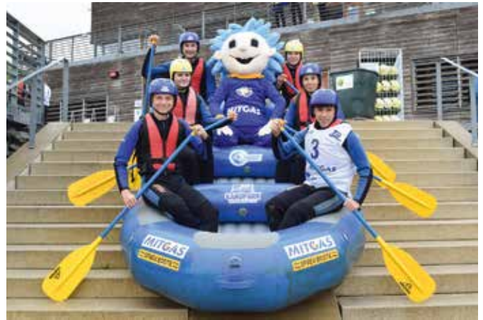
Schafften es 2021 bis ins Finale: Die „OSM Frogs“ von der Oberschule Markkleeberg.

Das MITGAS Schüler-Rafting dient der Sport- und Jugendförderung in Mitteldeutschland und findet in diesem Jahr zum 13. Mal