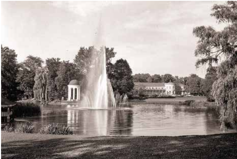
Parkteich und Parkgaststätte 1956

Der Bund erhob jedoch Einwände und fand die denkmalpflegerischen Aspekte nicht gründlich genug betrachtet. Weitere Monate verstrichen. Zum Markkleeberger Stadtfest 2016 sicherte uns der sächsische Verkehrsminister Martin Dulig bei seinem Besuch die volle Unterstützung zu und so gab schließlich der Freistaat Sachsen ein neues Gutachten in Auftrag.