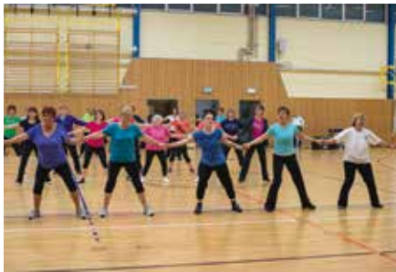
Zünftig beim Zumba: 280 Frauen treiben in der TSG-Abteilung Gymnastik gemeinsam Sport.

Seit über einhundert Jahren feiern wir den Internationalen Frauentag. Heute müssen wir nicht mehr um unsere Rechte kämpfen, wir haben längst einen Platz in der Gesellschaft gefunden. Wir sind engagiert und interessiert und sportlich sind wir auch.