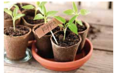
Bauen/Wohnen/Einrichten Start ins Gartenjahr 2022